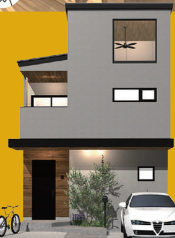
※外観イメージパース